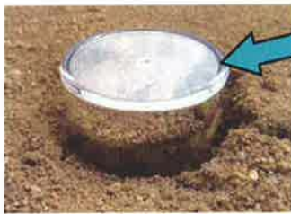
引用: 文科省HP (詳細は下記)